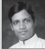
ಮಾ| ಬಾ| ಡೆನ್ಸಿಲ್ ಲೋಬೊ ವಸ್ತ್ರ ಯಾಜಕರ್