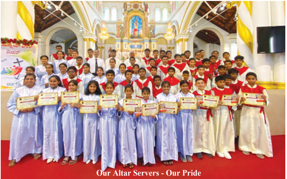
Our Altar Servers - Our Pride