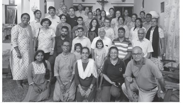
ಮಲ್ಲಿಕಟ್ಟೆ ತಿಸ್ರಾ ವಾಡ್ಯಾಚ್ಯಾ ಕುಟ್ಮಾಂಚೆಂ ಸಹಮಿಲನ್