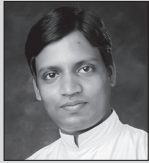
ಮಾ ಬಾ ಡೆನ್ಸಿಲ್ ಲೋಬೊ ವಸ್ತ್ರ ಯಾಜಕ್