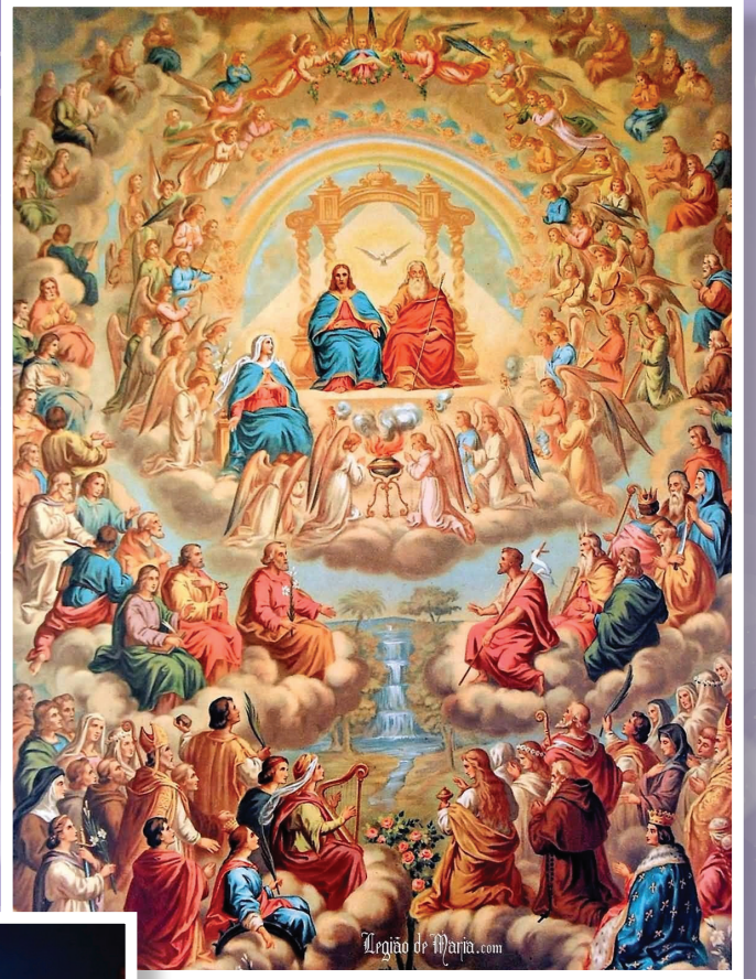
ನವೆಂಬರ್ 1 ಸರ್ವ್ ಸಾಂತಾಂಚೊ ದೀಸ್

“ಹಾ! ಸಾಂತಾಂಕ್ ಪಳೆಂವ್ಚೆಂ, ಸಾಂತಾಂ ಸವೆಂ ಆಸ್ಚೆಂ, ಸಾಂತ್ ಜಾಂವ್ಚೆಂ ತೆಂ ಕಿತ್ಲ್ಯಾ ಸ್ವಾಧಿಕ ಸಂತೊಸಾಚೆಂ!”