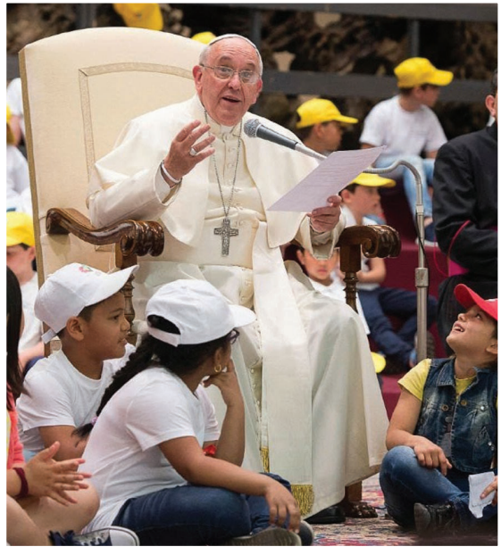
ನವೆಂಬರ್ 14 ಭುಗ್ಯಾಂಚೊ ದೀಸ್