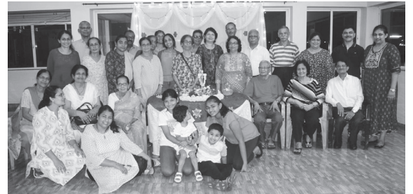
ನೊಡ್ ಕದ್ರಿ ದುಸ್ರಾ ವಾಡ್ಯಾಂತ್ ನವೆಂ ಜೆವಾಣ್