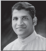
ಮಾ ಬಾ ಲೋರನ್ಸ್ ಕುಟನ್ಯೊ ಸಹಾಯಕ್