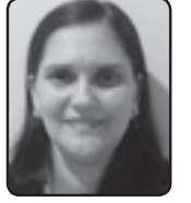
✍ ಉವಿನಾ ಪಿಂಕೊ ಕೈಬಟ್ಟಲ್ ಪಯ್ಲೆ ವಾಡೊ