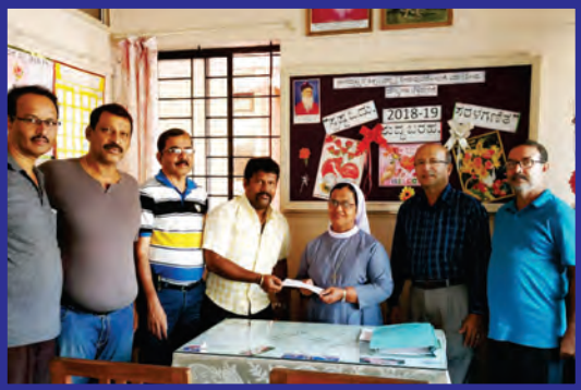
St Sebastian Kannada Medium Bendur ಇಸ್ಕೊಲಾಕ್ ತಾಂಚಿ ವಂತಿಗಿ