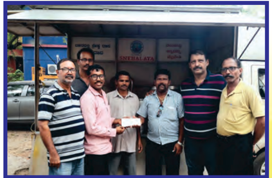
“MANNAH”, Snehalaya ವೆನ್‌ಲಾಕ್ ಅಸ್ಪೆಕ್ಟೆಂತ್ ದನ್ವರಾಂಚೆಂ ಜಿವ್ಣಾಣ್