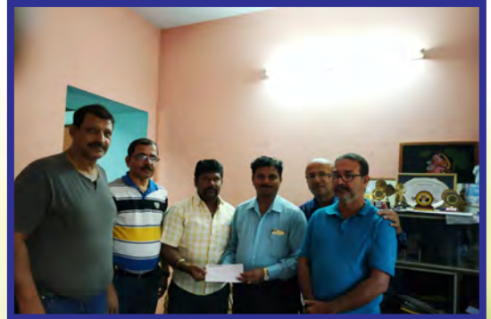
“CARDTS”, Aids ಪಿಡೆಂತ್ ವಳ್ಜಿಚ್ಚಾ ಭುರ್ಗ್ಯಾಂ ಖಾತಿರ್ ಮಯಮೊಗಾಚೊ ಸ್ಥಿಲಿತ್ ವಾಂಟುನ್ ಫೆಂವ್ಡ್ ಕುಮೊಕ್