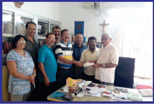
ಕಾಲ್ವರಿ ಇಸ್ಕೊಲಾಕ್ ತಾಂಜಾ ಉದಗ್ಗತೆಚಾ ಯೋಜನಾಂ ಖಾತಿರ್ ಆರ್ಥಿಕ್ ಸಹಾಯ್