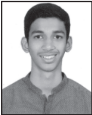
ಎವಿಯನ್ ಪ್ರಾಕ್ಯಾಂಕ್ ಪೂತ್: ವಿನಿಲೋಯ್ ಪ್ರಾಕ್ಯಾಂಕ್ ಆನಿ ವಿಯಾನ್ನಿ ಪ್ರಾಕ್ಯಾಂಕ್ ಹಾಂಚೊ ನೋಡ್ ಕದ್ರಿ ಪಯ್ಲೊ ವಾಡೊ ಅಂಕ್: 89 (ದಾವಿ ಕ್ಲಾಸ್)