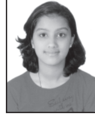
ಆರ್ಜುನ್ ಚಿತ್ಲ್ ಸಿಕ್ಲೇರಾ ಧುವ್: ಕ್ಲಿಟಸ್ ಸಿಕ್ಲೇರಾ ಆನಿ ಬ್ಲೊಸಮ್ ಸಿಕ್ಲೇರಾ ಹಾಂಚಿ ಕೈಬಟ್ಟಲ್ ತಿಸ್ರೊ ವಾಡೊ ಅಂಕ್: 91 (ಸಾತ್ವಿ ಕ್ಲಾಸ್)