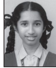
ಎಂಜಲ್ ರೀಶೊರ್ನ್ ಧುವ್: ರಶ್ಮಿ ಸಿಕ್ಲೇರಾ ಹಿಚಿ ಇಗರ್ಜೆ ಚವ್ತೊ ವಾಡೊ ಅಂಕ್: 85 (ಸಾತ್ವಿ ಕ್ಲಾಸ್)