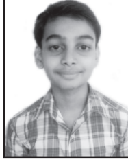
ಲಾಕ್ ರೊಮಾನ್ ನೊರೊನ್ವಾ ಪೂತ್: ಸುಜಿತ್ ನೊರೊನ್ವಾ ಆನಿ ಓಲಿವಿಯಾ ನೊರೊನ್ವಾ ಹಾಂಚೊ ಕಂಕನಾಡಿ ದುಸ್ರೊ ವಾಡೊ ಅಂಕ್: 92 (ಸಾತ್ವಿ ಕ್ಲಾಸ್)